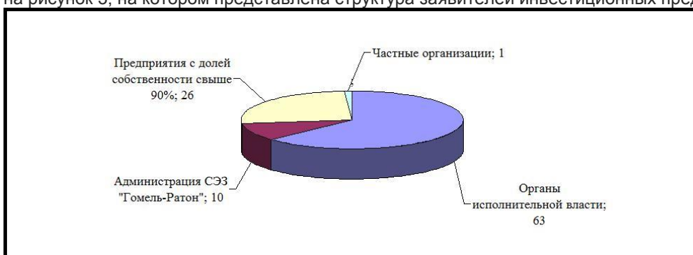
Рисунок 3 — Заявители инвестиционных проектов XI Гомельского экономического форума

Для того чтобы понять, кому в регионе интересен экономический форум, достаточно взглянуть на рисунок 3, на котором представлена структура заявителей инвестиционных предложений.