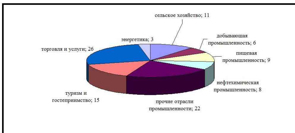
Рисунок 1 — Инвестиционные проекты XI Гомельского экономического форума в отраслевом разрезе