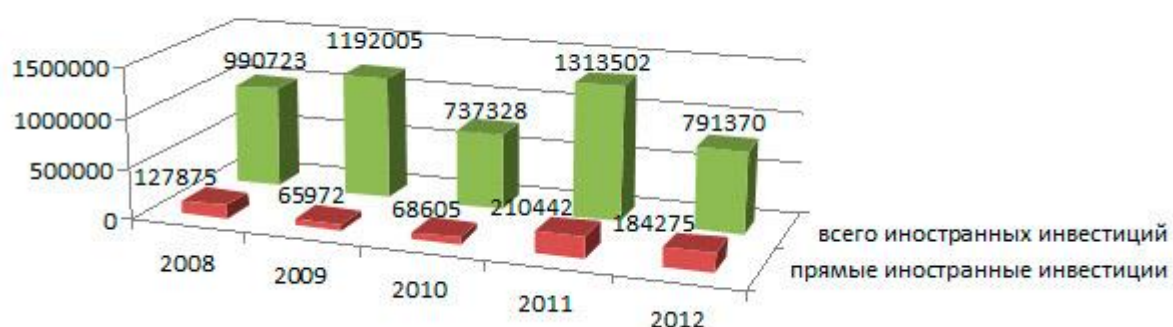
Рисунок 2 – Привлечение иностранных инвестиций в Гомельскую область в период с 2008 по 2012 гг., тыс. $.

Проблема привлечения иностранных инвестиций стоит не только перед Гомельской областью. При этом очевидно, что главную роль в данном аспекте играет политический фактор. Для того, чтобы это проиллюстрировать, рассмотрим рисунок 2.